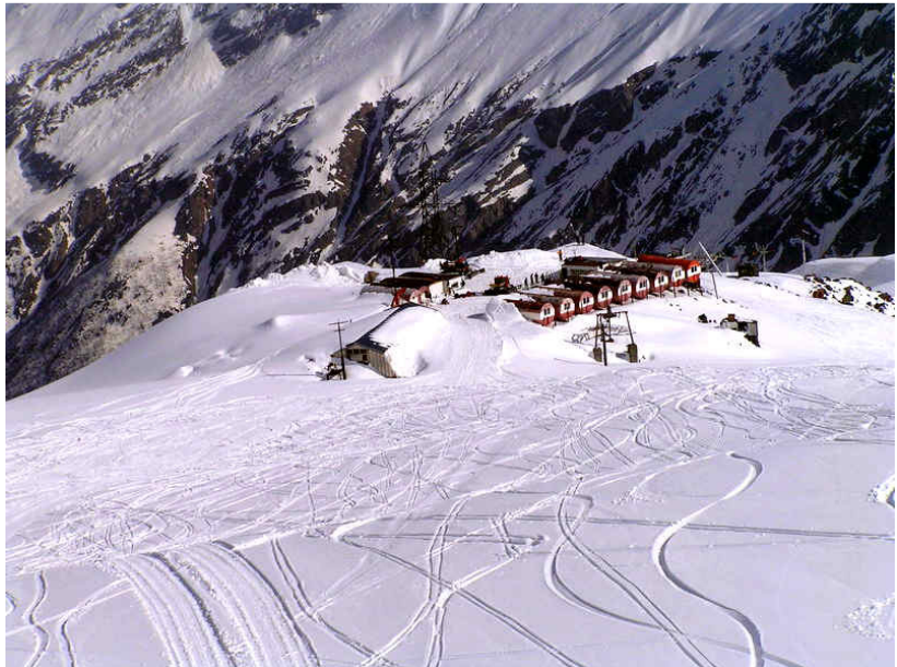
Barrel-Camp auf 3.750 m

Übernachtung im Hotel Elba in Doppelzimmern (F/M/A)